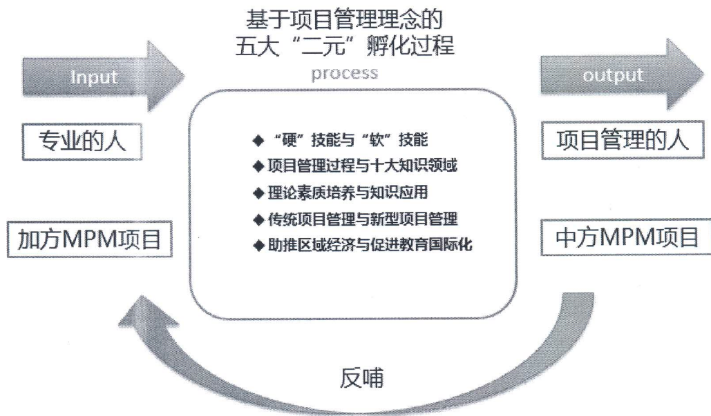
图3 IPO 培养模型

具有鲜明的办学特色。通过 IPO 培养模型，即输入专业的人和加方的 MPM 项目，通过基于项目管理理念的五大二元孵化过程，最终输出项目管理的人和中方的 MPM 项目，同时，中方的 MPM 项目又对加方的 MPM 项目进行反哺，进而推进加方 MPM 项目的再次发展。